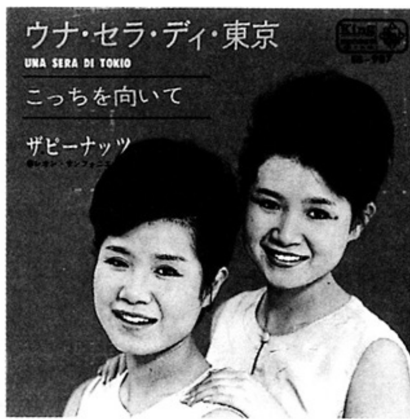
「ウナ・セラ・ディ・東京」ジャケット