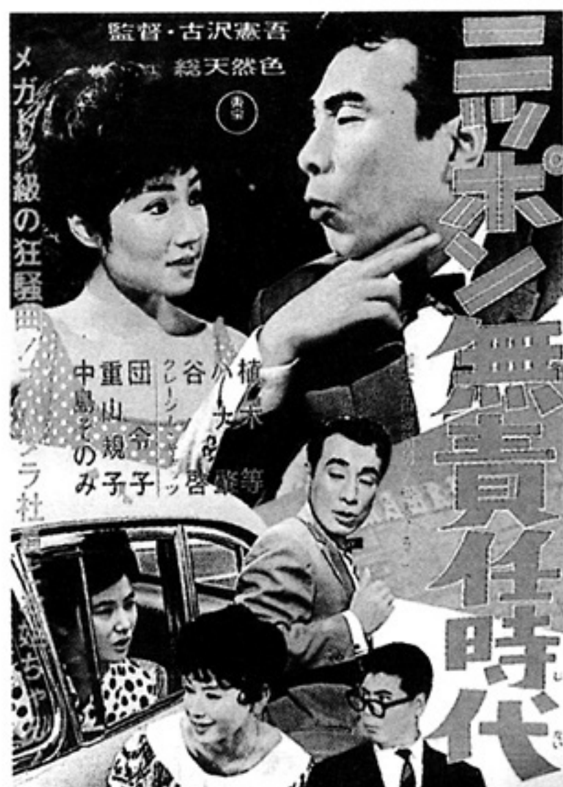
「ニッポン無責任時代」ポスター