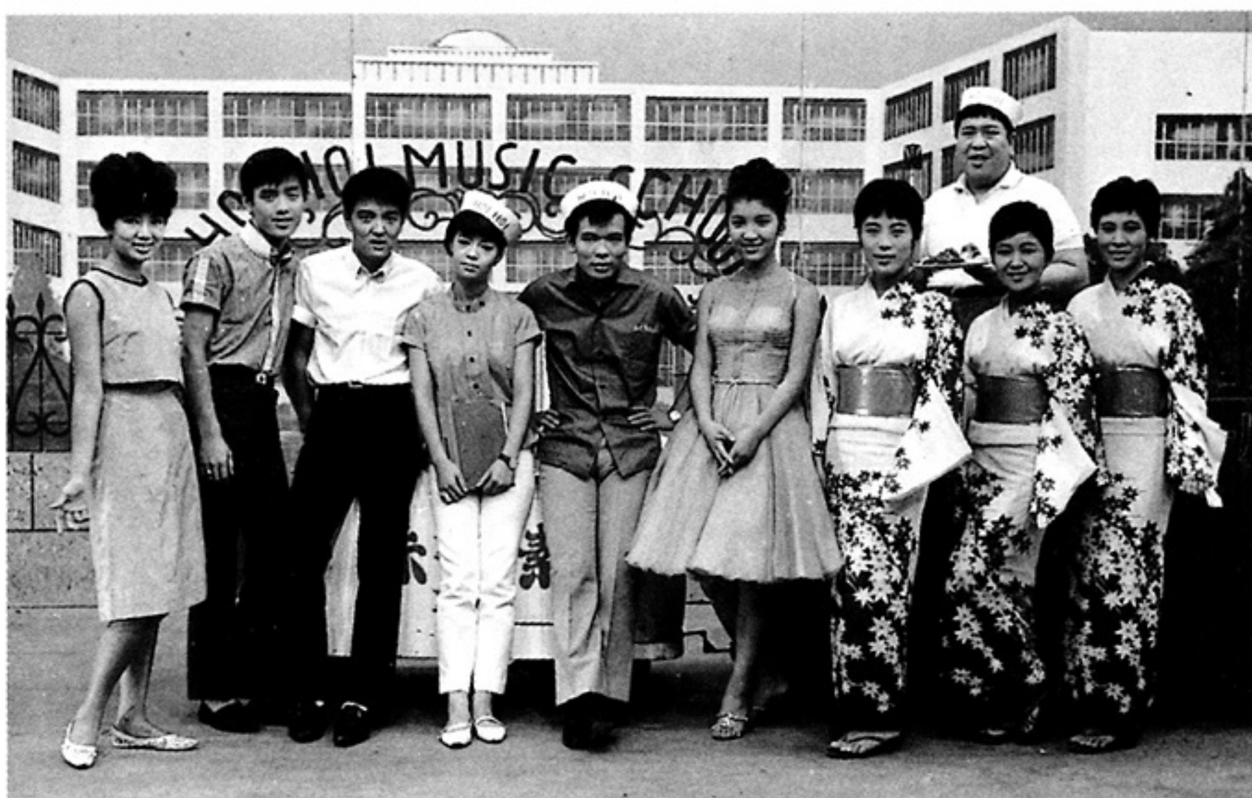
日本テレビ「ホイホイ・ミュージック・スクール」