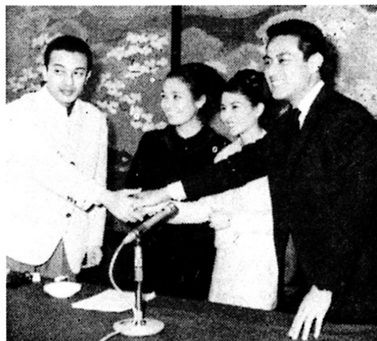
ぶろだくしょん「道」の俳優たち