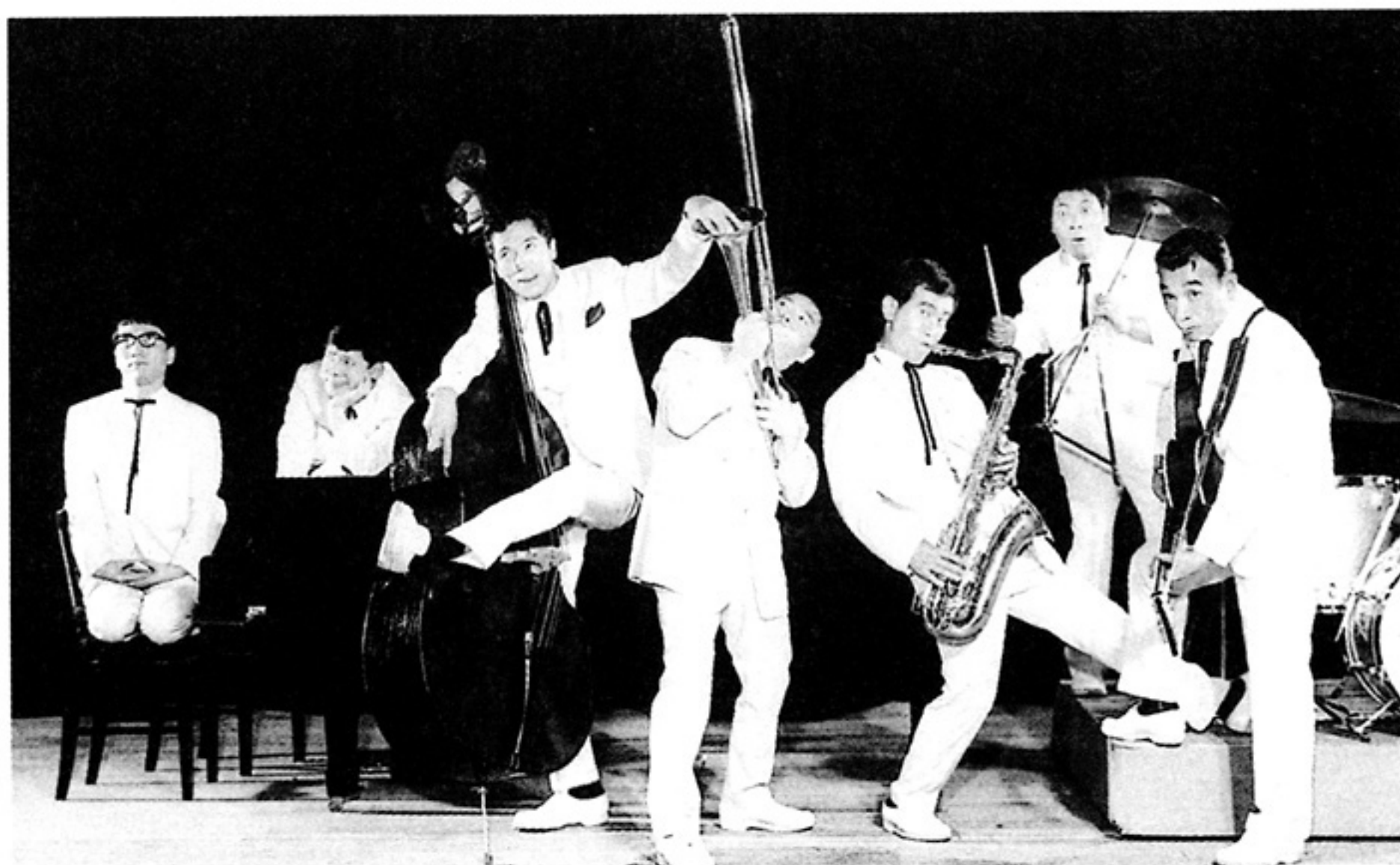
クレージー・キャッツのステージ