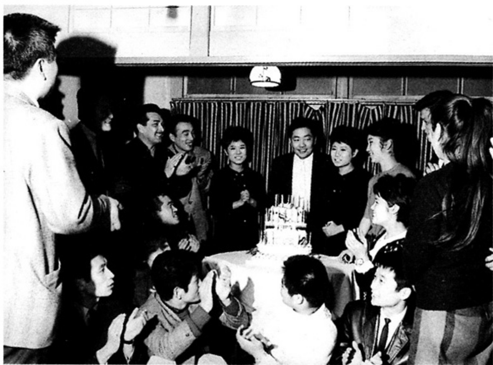
晋の誕生日を祝うタレントたち

ところが、当時のレコード会社にはプロデューサーという職制はなかった。社員のディレクター（ハウス・ディレクター）がレコーディングの指揮をとり、完成した作品は、営