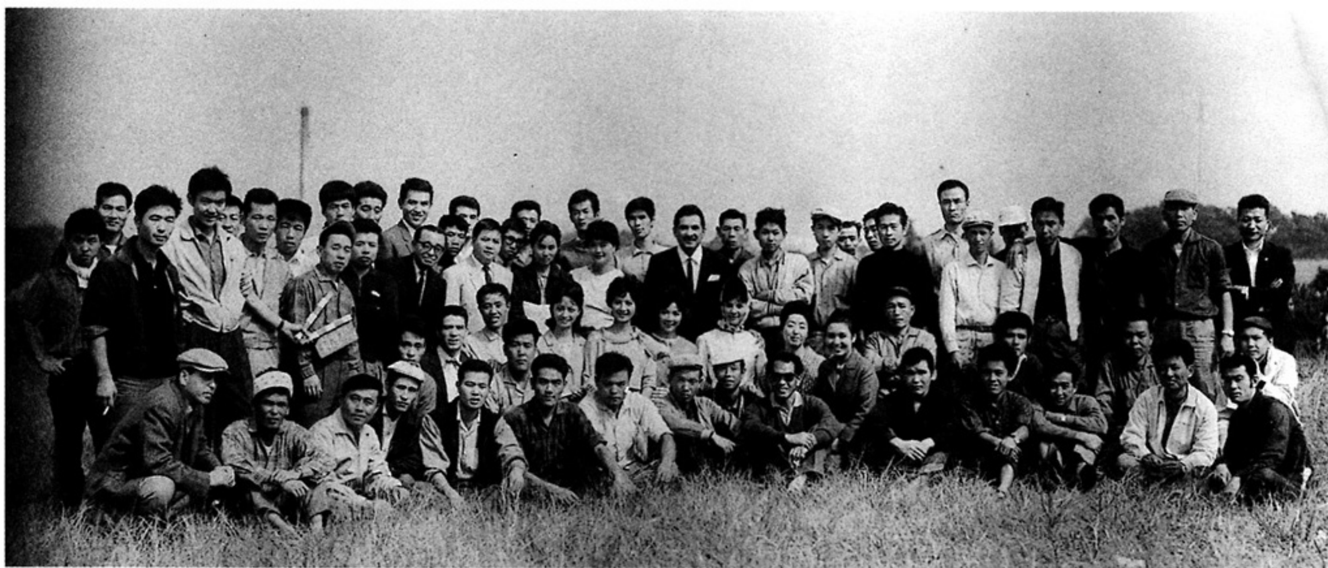
「若い季節」スタッフ・キャスト記念写真