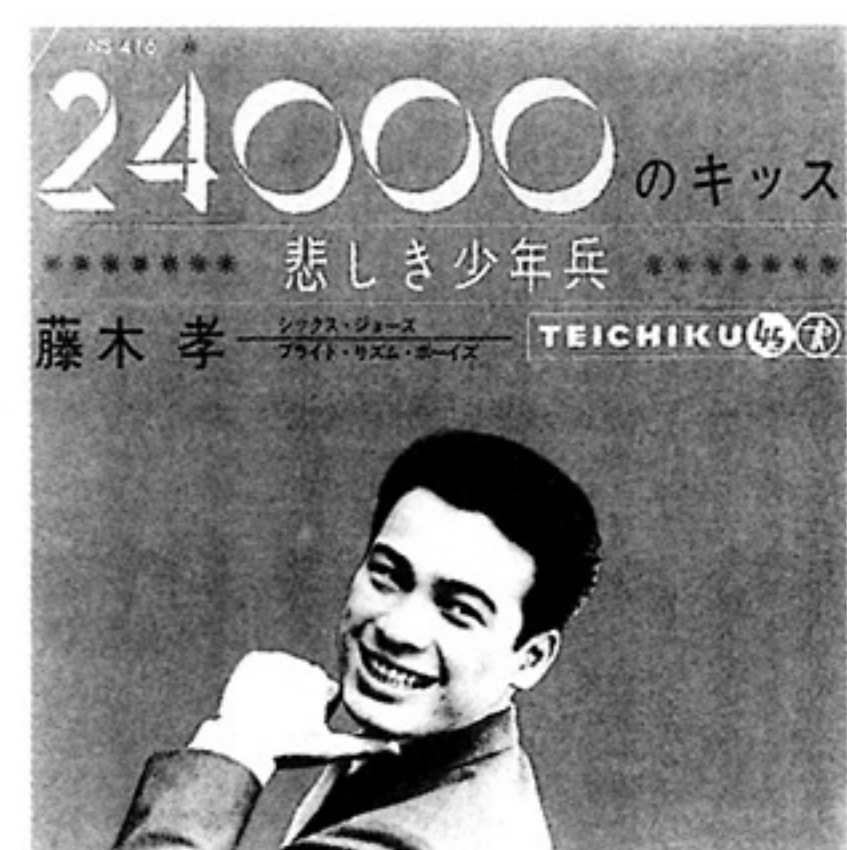
「24000のキッス」ジャケット

『24000のキッス』は狙いどおりヒットした。これを手土産に、彼は「シャボン玉」に出演する。セールス作戦の段階で、渡辺プロは藤木を連呼方式のルートに乗せた。その効果は目覚ましいものだった。その成功のなかで、晋と美佐は「もっとパンチのある曲を