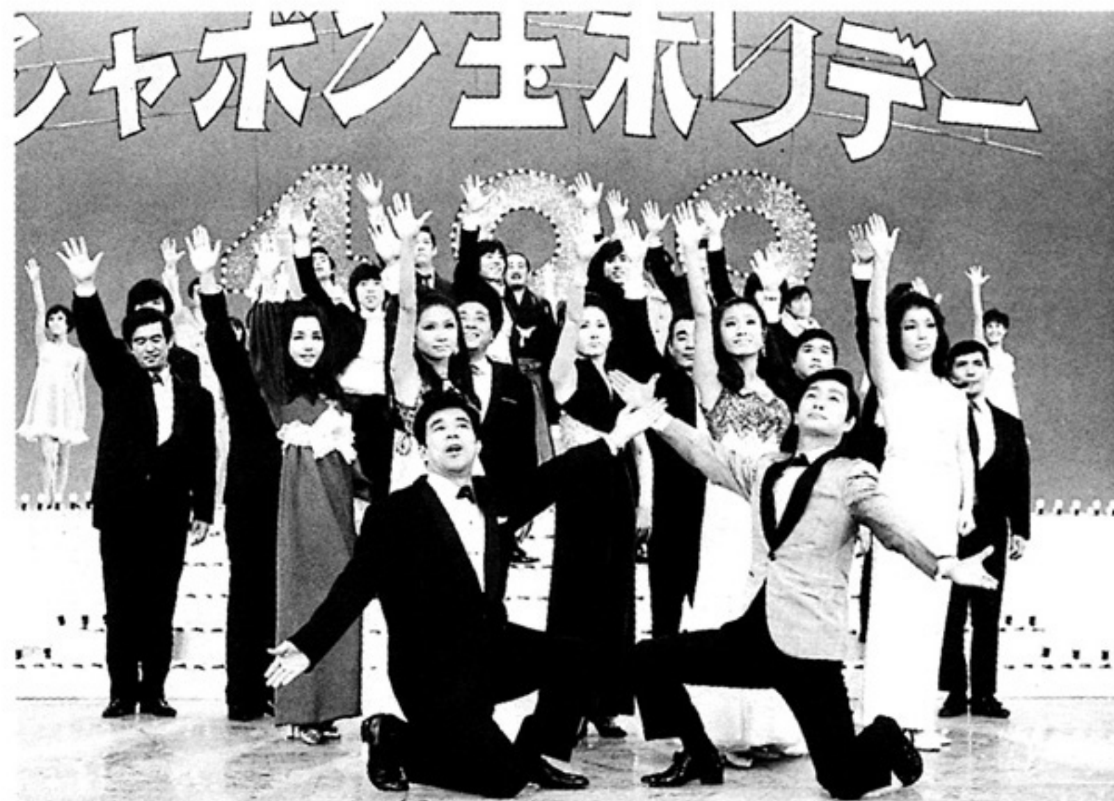
「シャボン玉ホリデー」