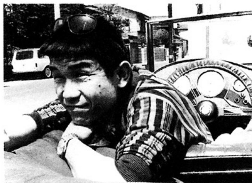
当時の青島幸男氏

そんな晋に、珍しい例外がふたつあった。ひとつは六七年八月二二日の電通夏季大学で、