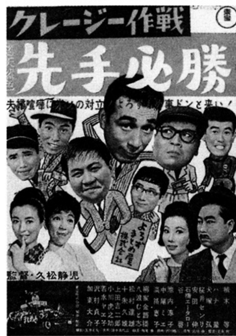
「先手必勝」ポスター