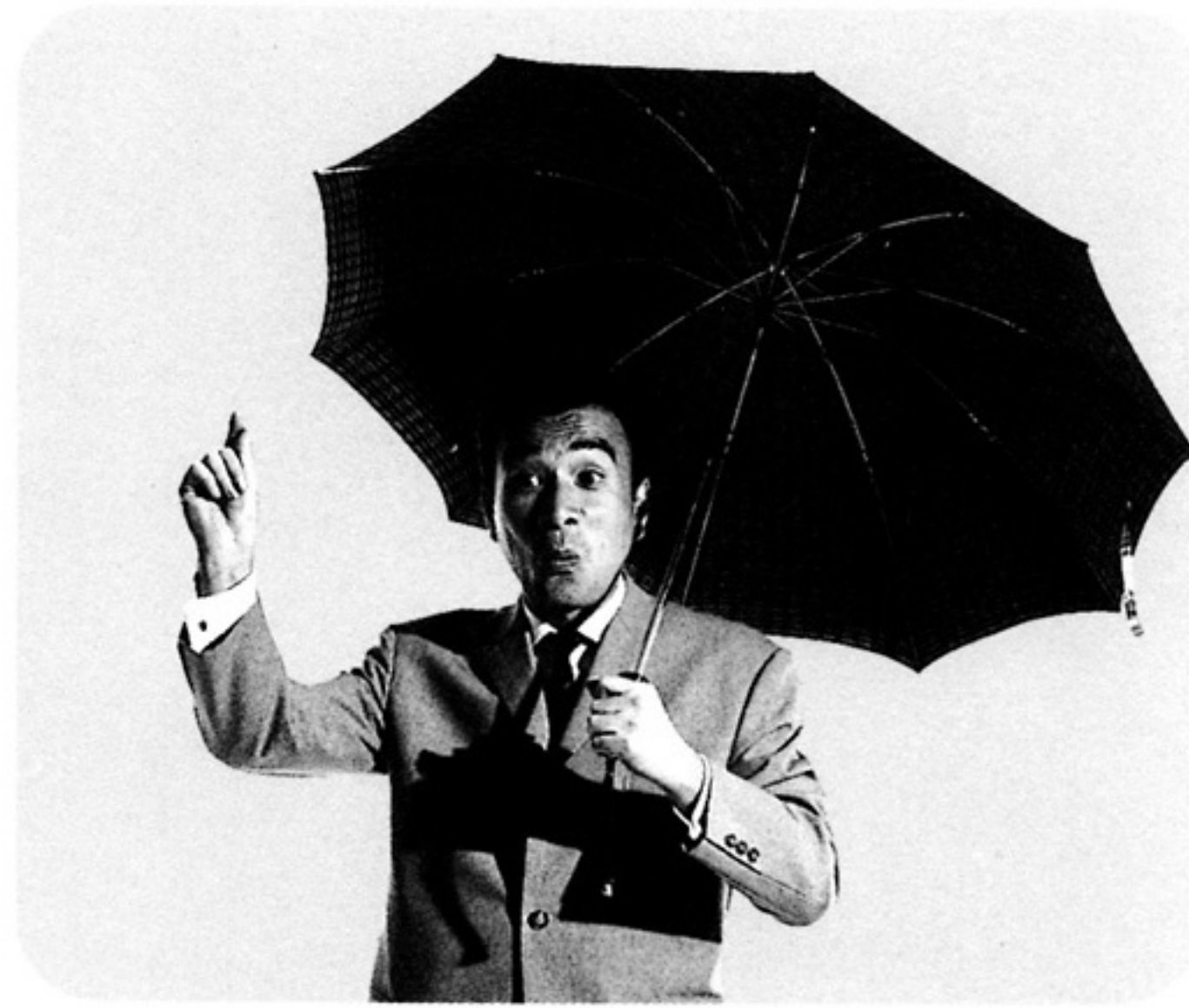
渡辺企画の初期CM「なんであるアイデアル」